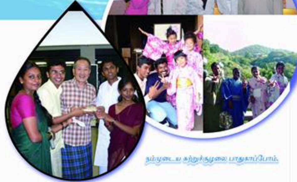
நம்முடைய கற்றுக்குழலை பாதுகாப்போம்.